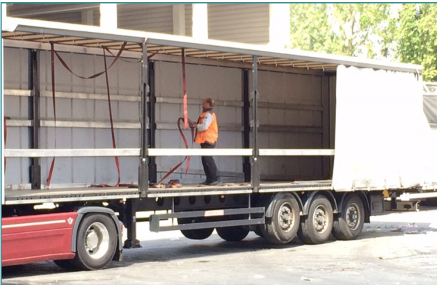
2. ábra – A tehergépjármű vezetője előkészíti a leköthévedereket