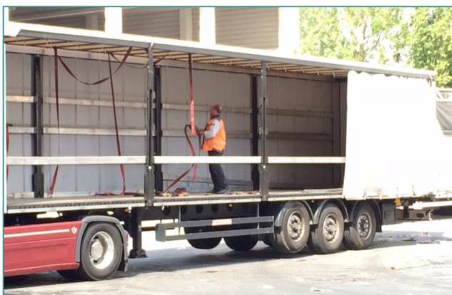
Fig. 2 - Il conducente del camion predispone le cinghie di ancoraggio