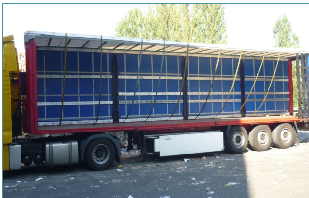
Fig. 3 - Cinghie di ancoraggio pronte all'uso